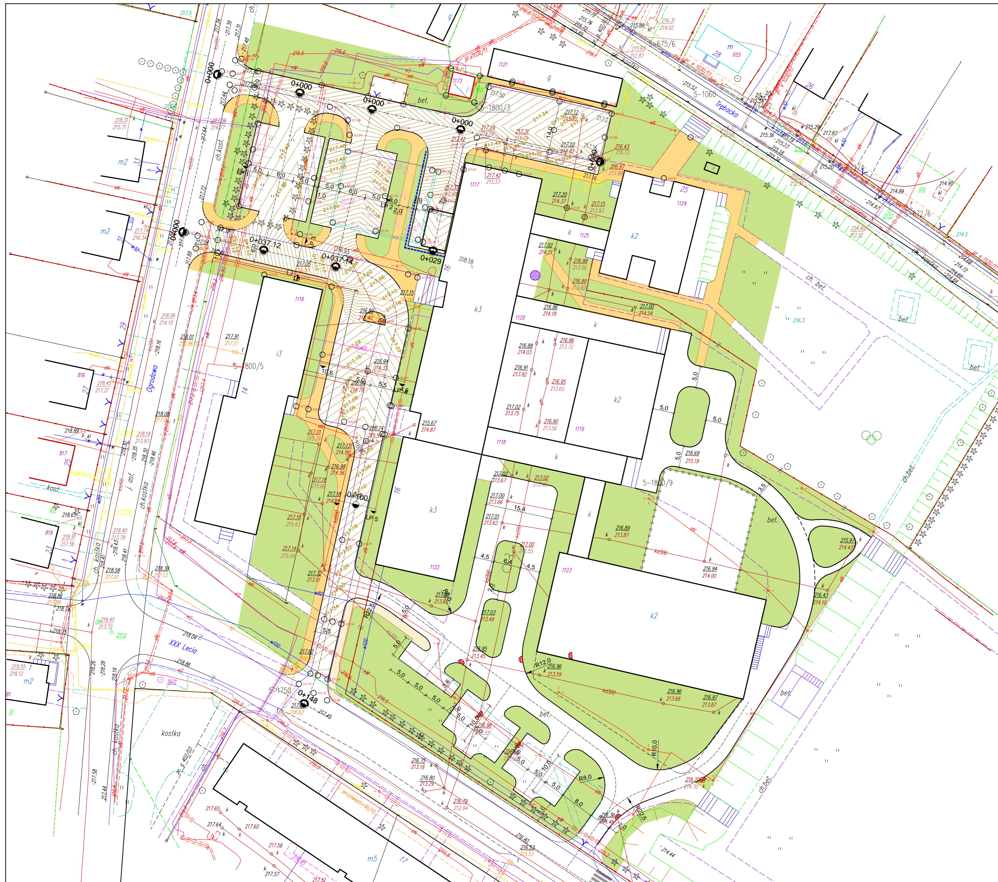
Rys. 1 Plan orientacyjny Skala 1:10 000